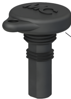
Stecker-Verschlusskappe Sealing cap for male cable coupler

Typ/Type: PV-SVK4 Bestell-Nr./Order No.: 32.0716