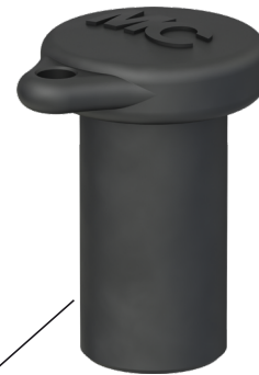
Buchsen-Verschlusskappe Sealing cap for female cable coupler

Typ/Type: PV-SVK4 Bestell-Nr./Order No.: 32.0716